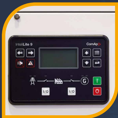
Logica di controllo