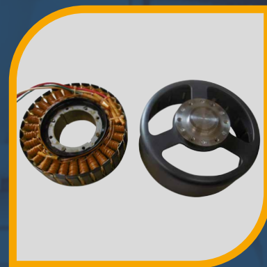
Alternatore a magneti permanenti (PMG)