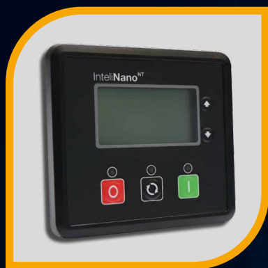
Pannello di controllo