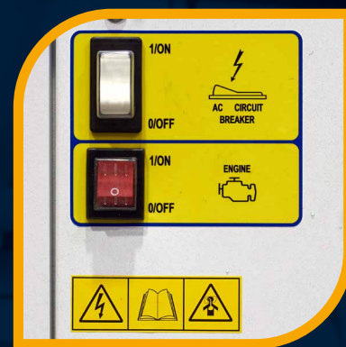
Interruttore termico generale

Offriamo oggi quello che gli altri faranno domani.