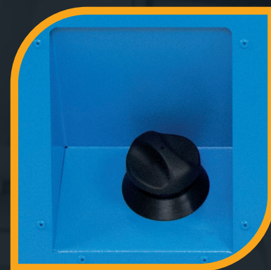
Serbatoio da 40 lt